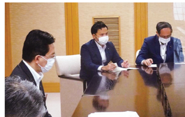
ヒアリングした内容を達増知事へ要望

また、コロナによって大きく社会が変化していく中で、注目が集まっている「ワーケーション」など新しい人の動きにも目を向け勉強会を開催しました。総務省大臣官房サイバーセキュリティ情報化審議官をお招きして、ワーケーションをテーマにコロナ禍の中で地方がどう動くべきかご講演頂き、関連する業種の皆様とともに活発な意見交換を行いました。