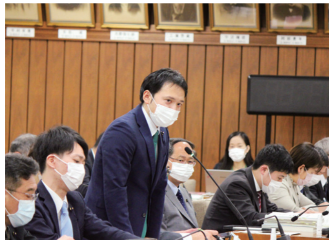
予算特別委員会での質問

2月定例会における予算特別委員会では県事業における成果指標の在り方、DX（デジタルトランスフォーメーション）の推進、教育現場における ICT の導入に伴う課題、県営住宅など公有資産の有効活用などについて質問しました。特に教育現場における ICT 機器導入の課題については、学習機会の均等・均質化を図ることや教職員の皆様の負担軽減を図るために ICT の利活用は必要不可欠ですが、同時に子供のスクリーンタイム（スマホなどの画面を見ている時間）が大幅に増加し、スマホ依存症に陥るリスクも考慮しなければなりません。子供のスマホ依存症は思考力や集中力の低下に繋がる可能性もあることから、自らの意思をコントロールできるようになる一定程度の年齢までは利用時間やコンテンツを規制する必要性を強く感じており、県教育委員会の見解を問うとともに利用時間やコンテンツを制限するメディアコントロールやメディアリテラシーの必要性を訴えました。