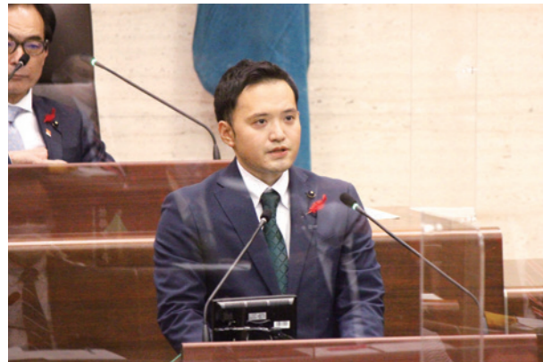
一般質問(12月定例会)

当選後 2 回目の一般質問では科学的根拠に基づいた政策立案をテーマに新型コロナウイルス感染症対策、いわて県民計画、人口減少対策、教育問題、県庁における DX（デジタルトランスフォーメーション）など各分野について質問しました。新型コロナウイルス感染症対策においては当初未知のウイルスということもあり、科学的知見が全くない状態の中で対策を講じなければいけないという難しい状況でしたが、時間の経過とともに新しい感染症に関する様々な知見が蓄積されていきました。感染経路や濃厚接触、持病のある高齢者の方のリスクが高いなど様々な科学的知見が蓄積したうえで、それらを根拠に政策立案（マスクの着用・三密の回避など）が為され、EBPM（エビデンスに基づく政策立案）